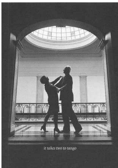
1998 It takes two to tango

Rijksdienst Beeldende Kunst (RBK), destijds onderdeel van het ministerie van Welzijn, Volksgezondheid en Cultuur, en voorloper van het huidige Instituut Collectie Nederland. Zijn verzameling kunstboeken schonk hij aan de Leidse universiteitsbibliotheek.