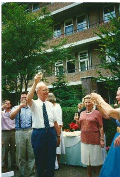
1997 Feestje in Den Haag

Rijksdienst Beeldende Kunst (RBK), destijds onderdeel van het ministerie van Welzijn, Volksgezondheid en Cultuur, en voorloper van het huidige Instituut Collectie Nederland. Zijn verzameling kunstboeken schonk hij aan de Leidse universiteitsbibliotheek.