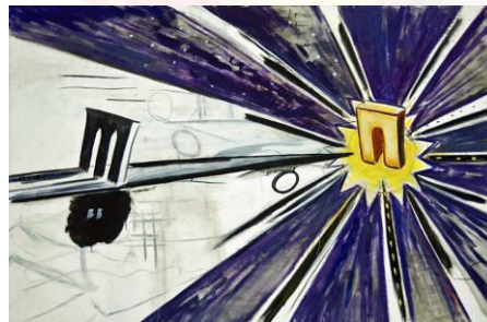
René Daniels Historia Mystera (1982)