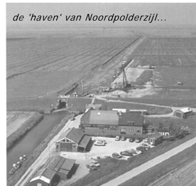
de 'haven' van Noordpolderzijk...