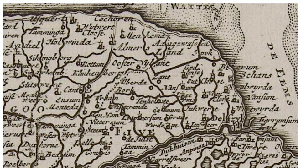
uit 17xx RUG archief

Er is uit de oude tijd nog erg veel niet bekend en vele gegevens Kaart