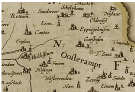
Kaart uit 1622 RUG archief

Op 16 maart 1678 trouwde te Westeremden Onne Cleveringh met Stijnje Luitens.