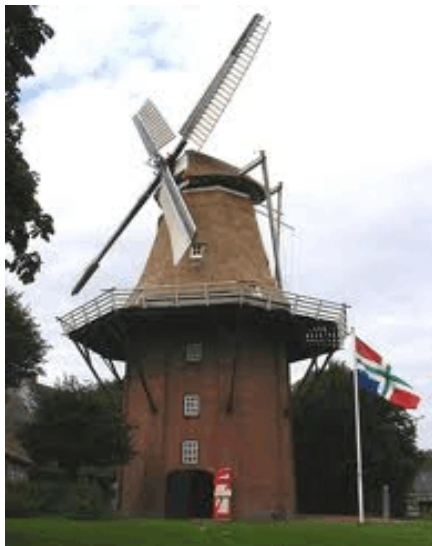
De Stellingmolen "Grote Geert"