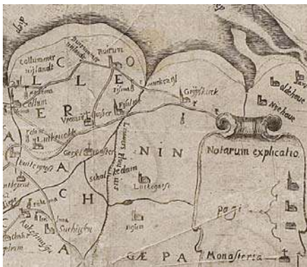
Kaart uit 1622 RUG archief

Het huis waarin ze woonden heette de Cleveringa State en lag ten noorden van het plaatsje Burum. Een State is de Friese naam voor een stenen huis, die in het Groningse een Heerd genoemd wordt. Van de familie is niets bekend en er dient nog uitgebreid onderzoek gedaan te worden in het Friesch Archief in Leeuwarden.